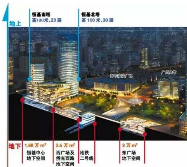
越秀恒基中心规划图