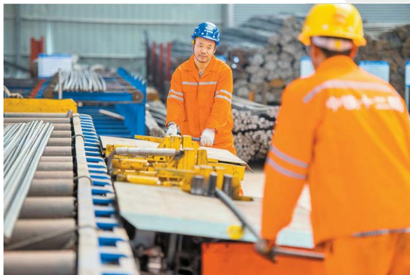
深圳外环高速施工现场