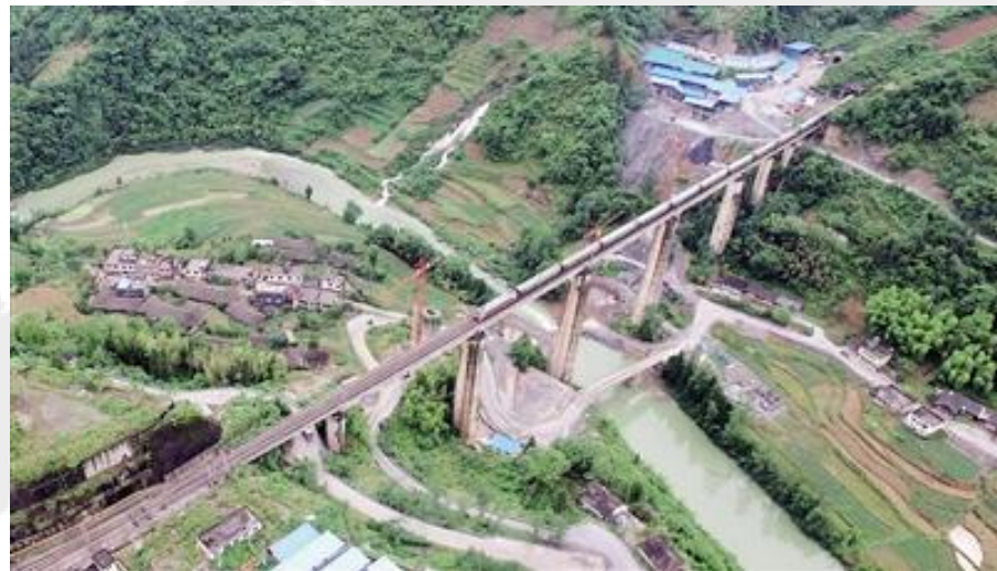
渝怀铁路二线鸟瞰图