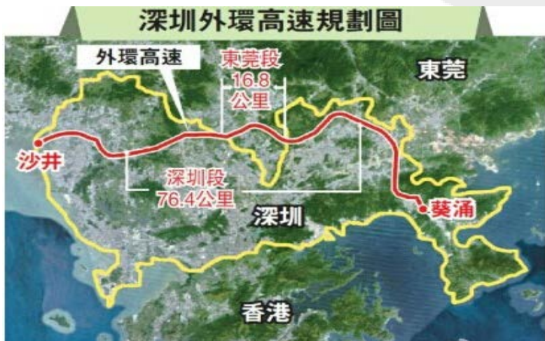
深圳外环高速规划图